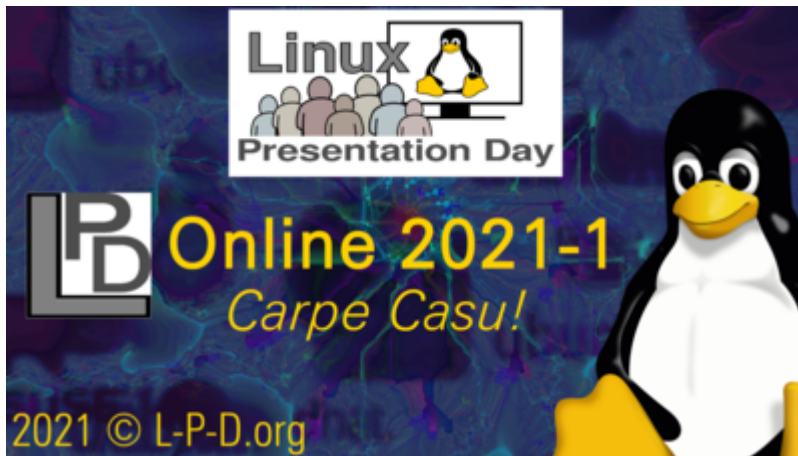
LPD-Online 2021-1 Video-Header/Footer