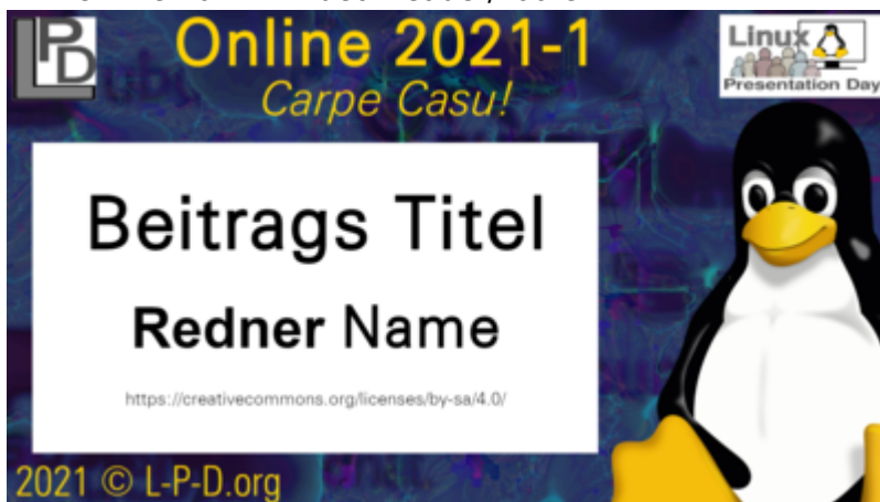
LPD-Online 2021-1 Video-Teaser

Der Header wird 5 Sekunden vor dem Video und 5 Sekunden am Ende zu sehen sein. Nach dem Header folgt der Teaser für 5 Sekunden, welcher den Titel und Namen der Vortragenden enthält.